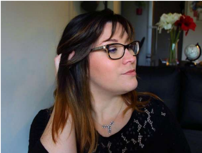
Coupe et couleur Après

J'ai été assez audacieuse de partir sur un changement radical de tête sans connaître le salon mais les posts Instagram et le site Internet reflètent parfaitement le travail brillant de cette équipe !