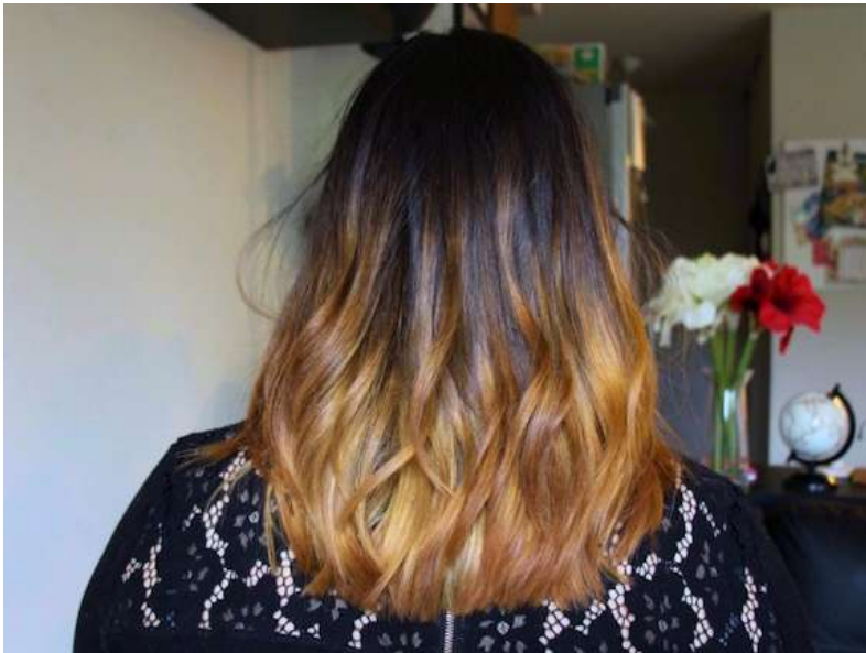
Ombre à la lumière naturelle en Intérieur