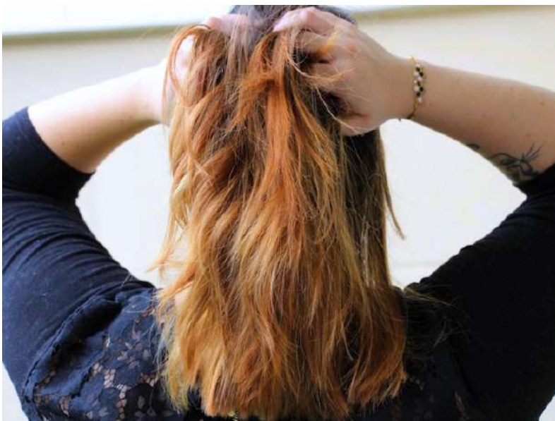
Ombre à la lumière naturelle en extérieur