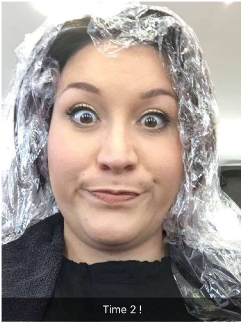
Pose de la décoloration