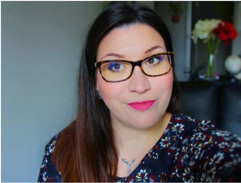
« Coupe » et couleur Avant